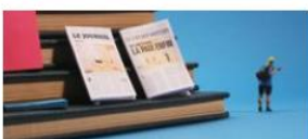
Les journalistes sont-ils objectifs ?