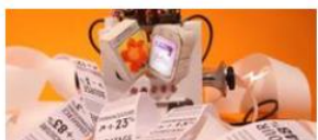
L'info en continu, comment faire le tri ?