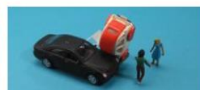
La loi de proximité