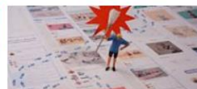
C'est quoi le droit à l'oubli numérique ?