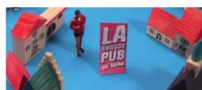
La publicité dans les médias