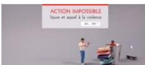
Ça veut dire quoi le blasphème ?