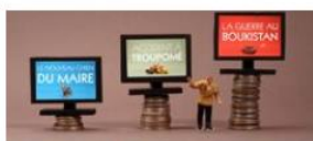
Le coût de l'information