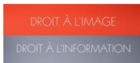
Qu'est-ce que le droit à l'image ? Qu'est-ce que le droit à l'information ?