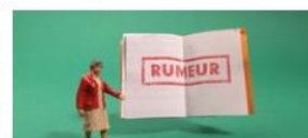
Gest quoi la rumeur ?