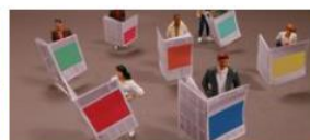
Le pluralisme des médias