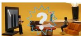
La théorie du complot