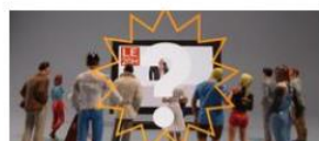
Qu'est-ce que l'audience ?