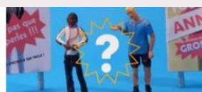
Deux poids deux mesures ?