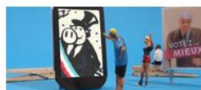
A quoi sert la caricature ?