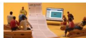
Un réseau social, ce n'est pas un journal