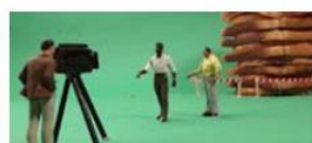
Les journalistes disent-ils tous la même chose ?