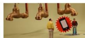
Qu'est ce qu'une source ?