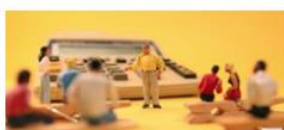
Nous sommes tous médias