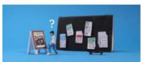
La hiérarchie de l'info