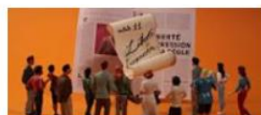
La liberté d'expression et ses limites