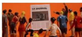
C'est quoi une information ?